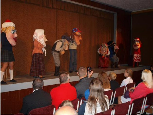
Kalvarijos teatras „Titnagas“

Rugsėjo 8 d. surengtas teatrų festivalis „Bičiuliai“, kuriame dalyvavo Kalvarijos krašto teatrai, Kalvarijos teatras „Titnagas“, taip pat 3 teatrai iš Dzūkijos, Aukštaitijos ir Žemaitijos.