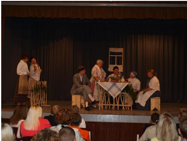
Varėnos raj. Matuizų mėgėjų teatras „Giraitė“