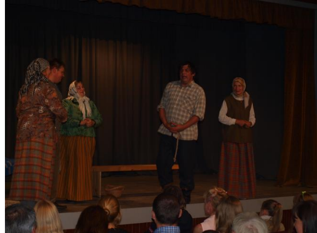
Mažeikių raj. Vieksnių mėgėjų teatras

Projekto įgyvendinimo metu įsigytos teatrinės kaukės, garso, kompiuterinė technika, konferencijų įranga, fotoaparatas, scenografijos medžiagos, maitinimo paslauga. Išleista knyga „Kalvarijos krašto teatras šimtmečio vygėj“, kuri pristatyta Kalvarijos savivaldybės gyventojams.